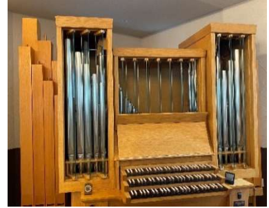
Sapporo Kotoni Church