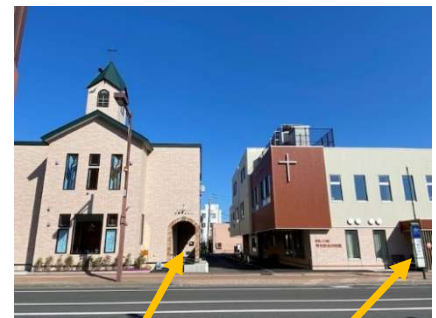
教会入口 ここがバス停です

函館本線 JR 琴似駅の改札を出て左へ進むと、琴似栄町通りに出ます。その信号を北海道銀行側に渡り、そのまま通りに沿って300mほどお進みください。イムス札幌消化器中央総合病院の先の十字架のついた建物です。